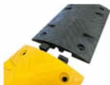
Système de liaison intégré